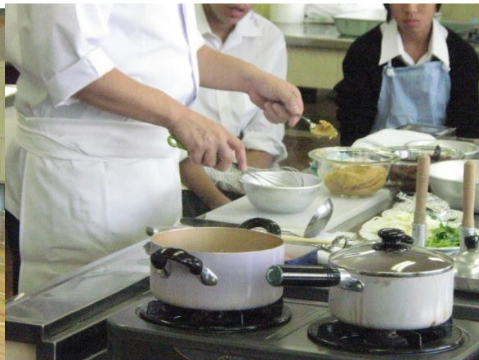
調理師・日本料理実習