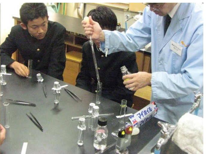
クロマトグラフィによる色素分析

中野区で初の試みです。区内の専門学校協会の全面的なバックアップをいただき、14コースの体験授業が実施できました。生徒たちは、各専門学校で用意していただいた「本物」に触れ、感動的な体験をすることができました。関係各位に感謝いたします。