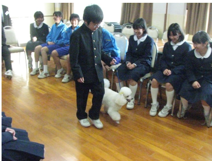
愛犬・グルーミング体験