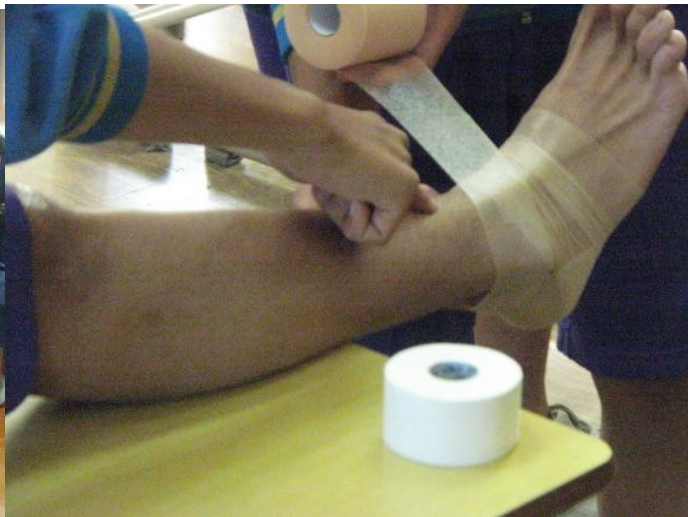
テーピング法体験