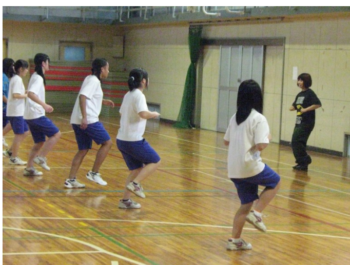
ダンスインストラクター体験