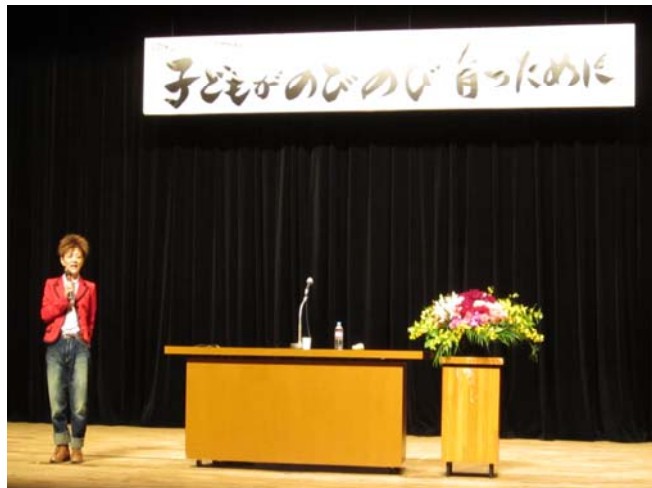
マイクを片手に壇上を動き回っての講演

中野区立中学校PTA連合会50年の集い特別講演会として去る10月19日(水)19:00より中野ゼロ小ホールにて開催されました。平日の夜7時からという保護者にとってはやや厳しい設定にも関わらず全12校からの保護者、教育委員会、教職員の皆様、各関係諸団体の皆様など400名を超える来場者でホールはほぼ満席となりました。